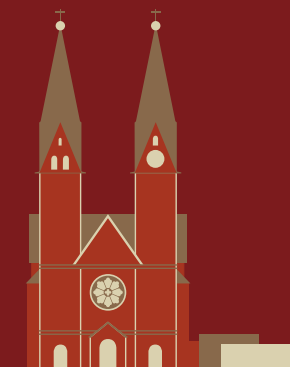
ST. MARIEN-DOM HAMBURG